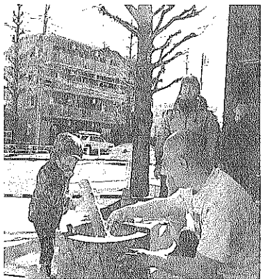
昨年の餅つき大会の様子

昨年好評だった「もちつき大会」を今年も開催します。お子様と一緒に是非ご参加ください。会場:支部事務所前